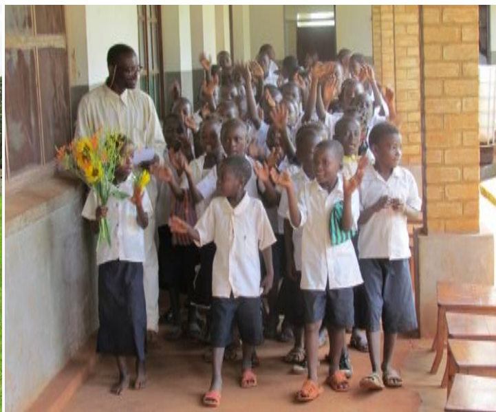
Gruppo della scolarezza con insegnanti