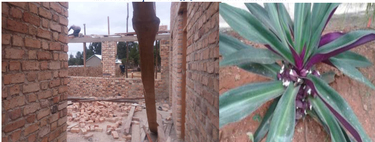
Questa cucina sarà utilizzata per preparare il pranzo a 950 studenti. Il completamento è previsto entro il mese di agosto