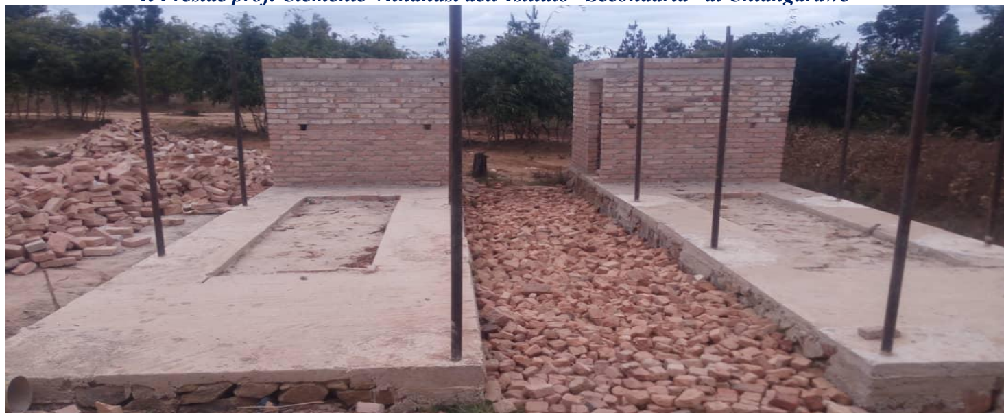
lavori in corso per la realizzazione della cucina dell'istituto